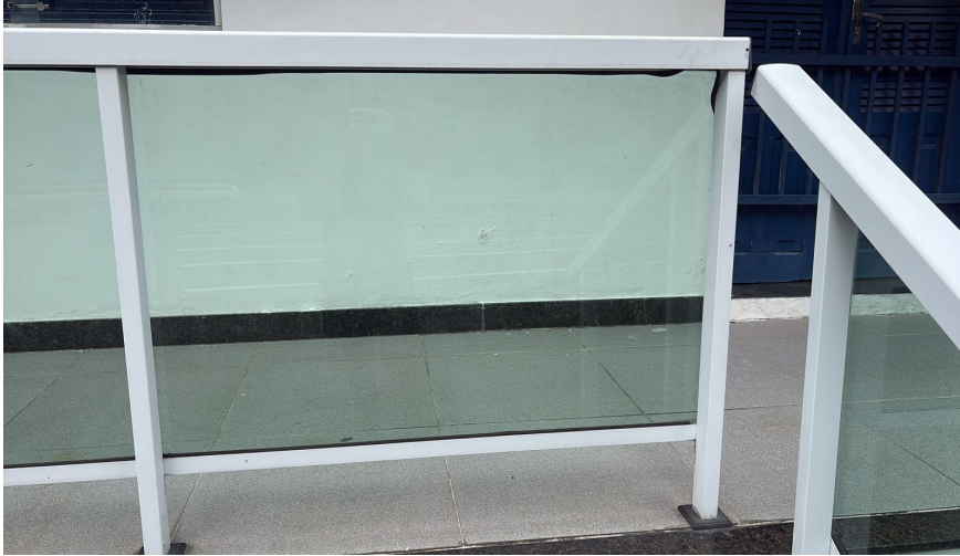
3.7 vidros de 3mm canelados