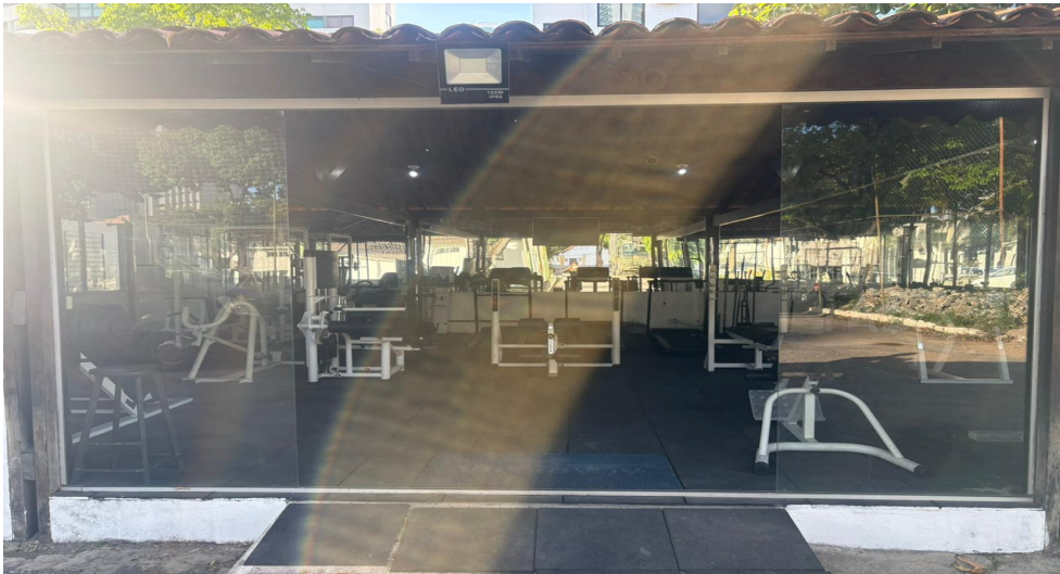
3.4 Porta Blindex