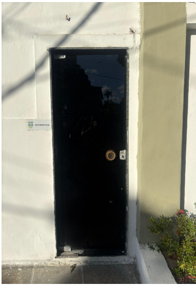
3.3 Porta blindex de 2,20mX2,23m