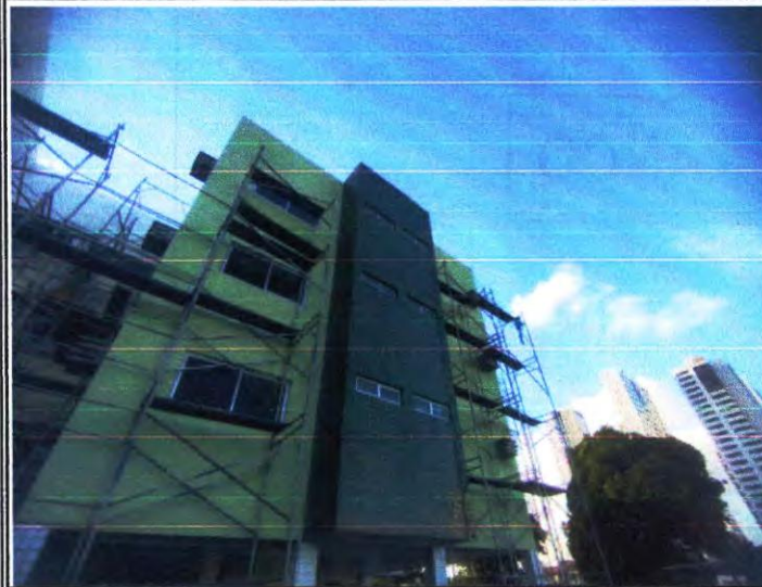
SERVIÇO DE APLICAÇÃO DE TEXTURA

INFORMO QUE FORAM REALIZADOS OS SERVIÇOS REFERENTE APLICAÇÃO DE FUNDO PREPARADOR E TEXTURA NAS FACHADAS DO PNR. INFORMO AINDA QUE OS SERVIÇOS ESTÃO EM ANDAMENTO DE ACORDO COM O CRONOGRAMA FISICO-FINANCEIRO DA OBRA. VALE RESSALTAR QUE ESTÁ SENDO FEITO OS SERVIÇOS DA PARTE INTERNA DOS APARTAMENTOS PARA CONCLUSÃO DA OBRA.