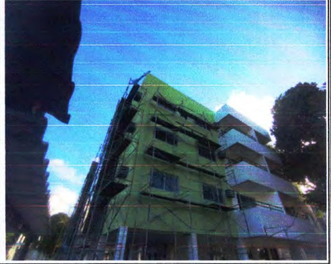
SERVIÇO DE APLICAÇÃO DE TEXTURA