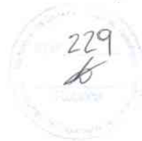
CLEITON BRITO DANTAS DE GOES - 1º Ten Encarregado da Seção de Aquisição Licitação e Contratos