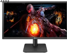
Monitor 21,5" Lg Va Fhd Hdmi 22Mp410-B.Awzm...

R$ 1.060,24 até 12x de R$ 88,35 sem juros