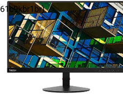
Monitor 21,5" Lenovo S22E-19 Wide Va 61C9Kbr1Br...