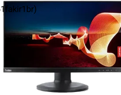
Monitor 21,5" Lenovo S22E-18 ThinkVision 61FAKIR1BR...

( https://www.processtec.com.br/produto/produto/215-lenovo-s22e-18-thinkvision-61FAKIR1BR ) ( https://www.processtec.com.br/produto/produto/215-lenovo-s22e-18-thinkvision-61FAKIR1BR ) ( https://www.processtec.com.br/produto/produto/215-lenovo-s22e-18-thinkvision-61FAKIR1BR ) ( https://www.processtec.com.br/produto/produto/215-lenovo-s22e-18-thinkvision-61FAKIR1BR )