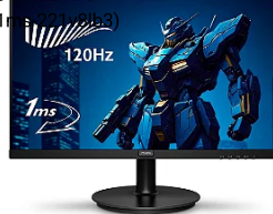
Monitor Gamer Philips 21,5" FHD VA 120Hz 1ms - 221V8LB3...