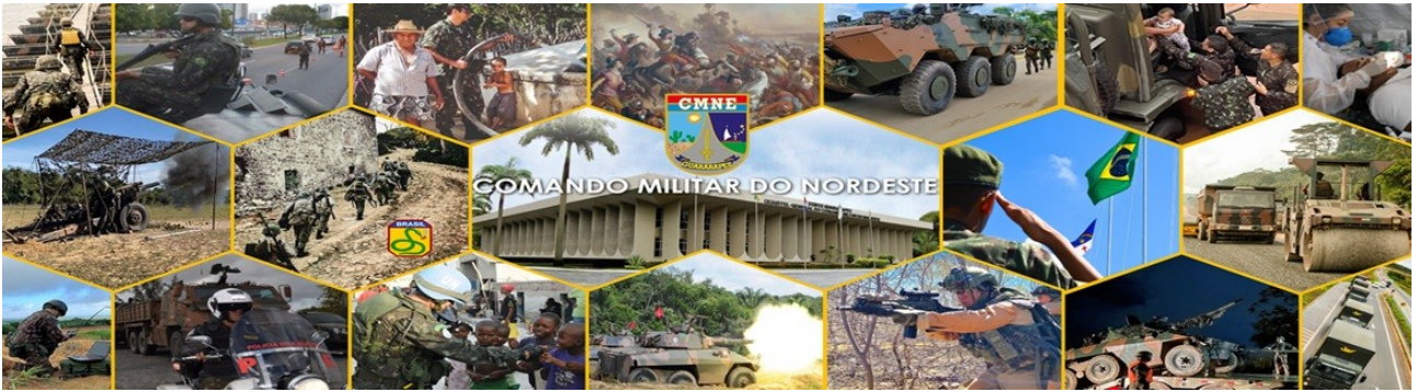
adesivo vinílico, medindo 2,50m x 8,20m