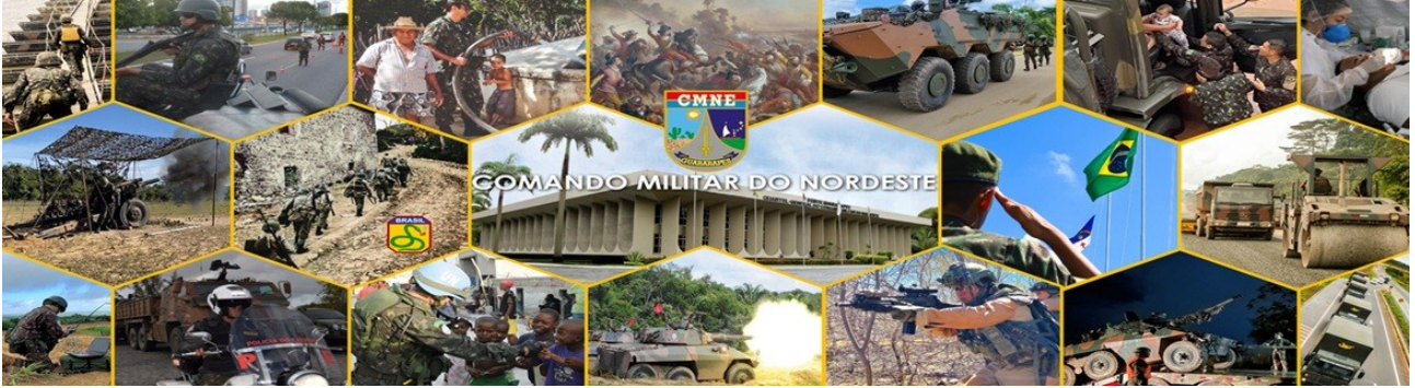
adesivo vinílico, medindo 2,50m x 8,20m