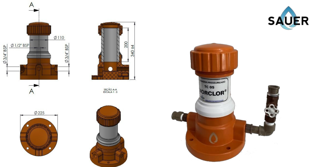
Foto do Equipamento pré-montado