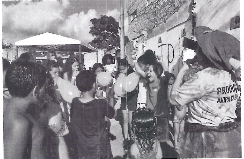
Pautas têm várias abordagens de iniciativas pelos direitos de crianças e adolescentes