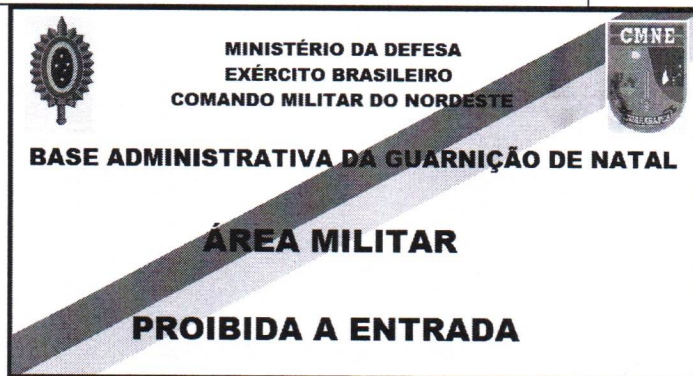
Imagem 01/01 – PLACA SINALIZAÇÃO