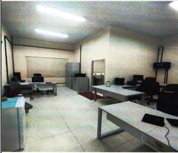
SALA DE OPERAÇÕES