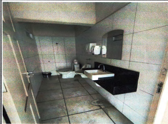
BANCADA DE GRANITO E CUBA