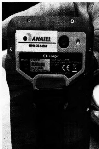
Coletor com número de série