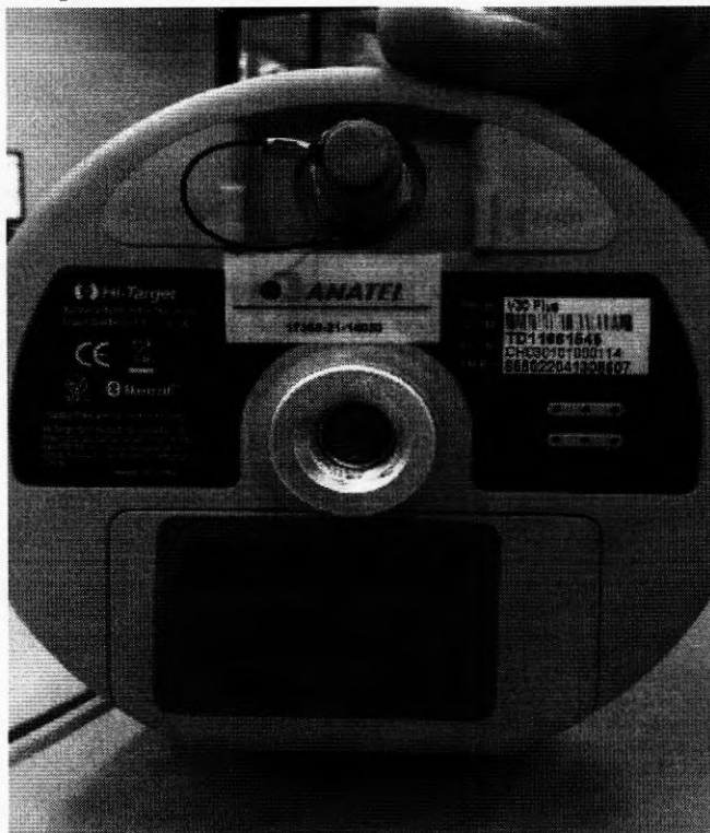
Receptor Base com número de série