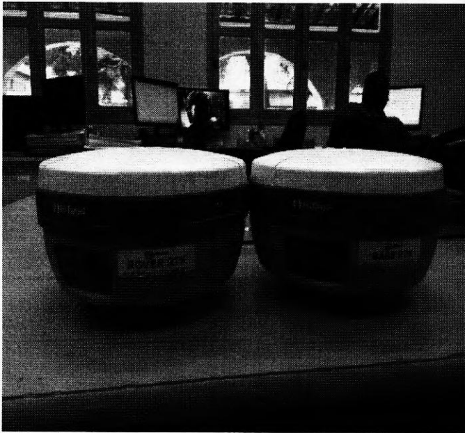
Par de receptores GNSS