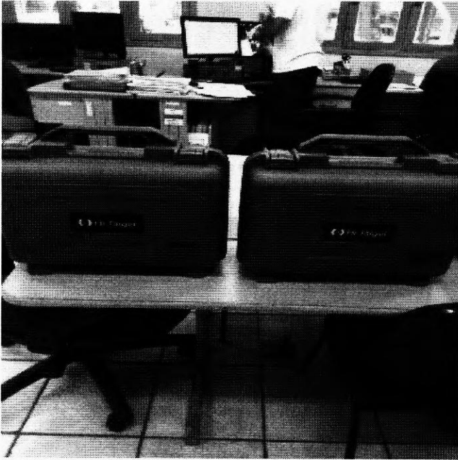
Equipamento acondicionado em duas maletas