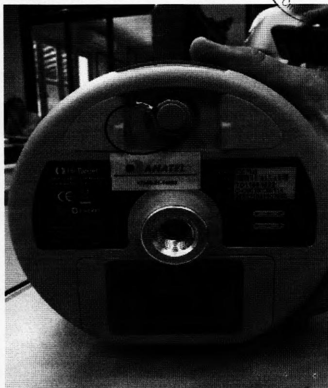
Receptor Rover com número de série