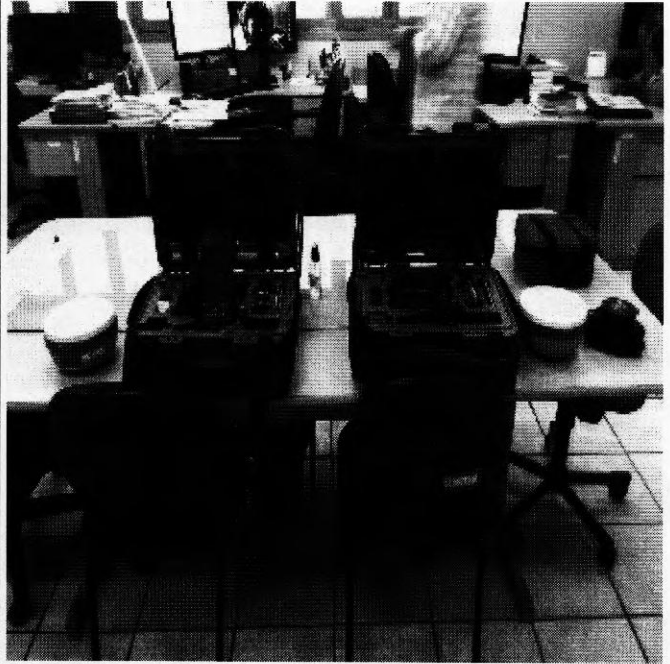
Vista geral de todo material