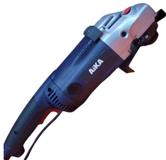
POLITRIZ DE PISO ELÉTRICA 220V