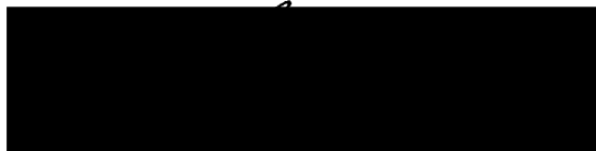
Chefe da 3ª Seção